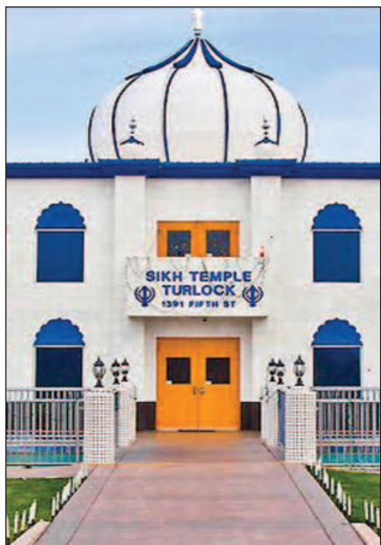
ਗੁਰਦੁਆਰਾ ਸਾਹਿਬ ਟਰਲੋਕ, ਕੈਲੇਫੋਰਨੀਆ ਦਾ ਚੌਥਾ ਸਾਲਾਨਾ ਨਗਰ ਕੀਰਤਨ 15 ਮਾਰਚ ਨੂੰ। (ਹੋਰ ਜਾਣਕਾਰੀ ਲਈ ਦੇਖੋ ਆਖਰੀ ਸਫ਼ਾ)

ਇਸ ਸਾਲ ਵੀ ਹੈਲੀਕਾਪਟਰ ਰਾਹੀਂ ਕੀਤੀ ਖਾਲਕੀ ਸਾਹਿਬ ਤੇ ਫੁੱਲਾਂ ਦੀ ਵਰਖਾ