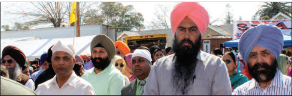
ਸ੍ਰੀ ਗੁਰੂ ਰਵਿਦਾਸ ਸਭਾ ਸੈਕਰਮੈਂਟੋ, ਜਿਹਨਾਂ ਨੇ ਗੁਰਪੁਰਬ ਅਤੇ ਨਗਰ ਕੀਰਤਨ ਦਰਮਿਆਨ ਕਿਸੇ ਵੀ ਕਿਸਮ ਦੀ ਸੇਵਾ ਨਿਭਾਈ, ਉਹਨਾਂ ਦੇ ਨਾਂ ਅਕਾਲ-ਪੁਰਖ ਜਾਣੀ-ਜਾਣ ਹੈ, ਉਹਨਾਂ ਸਾਰਿਆਂ ਦਾ ਕੋਟਿਨ-ਕੋਟਿ ਧੰਨਵਾਦ ਕਰਦੀ ਹੈ।